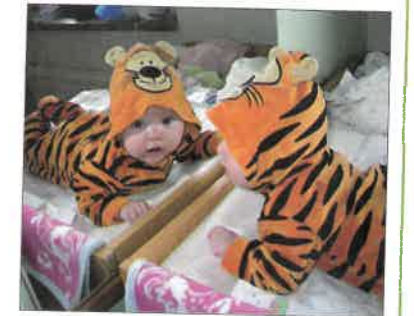
zvedání hlavičky dítěte

Vývoj každého dítěte je individuální, některé děti vůbec nelezou, začínají se rovnou stavět a chodit. Některé děti začnou chodit až ve věku kolem 15 měsíců. Tělesný vývoj souvisí s rozvojem duševních schopností.