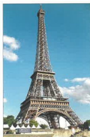
Eiffelova věž v Paříži – do roku 1930 nejvyšší stavba na světě

Na mapě koloniálních zisků v příloze učebnice ukažte území ovládané Ruskem.