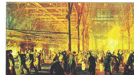
Výrobní hala ocelářského podniku v USA na počátku 20. století