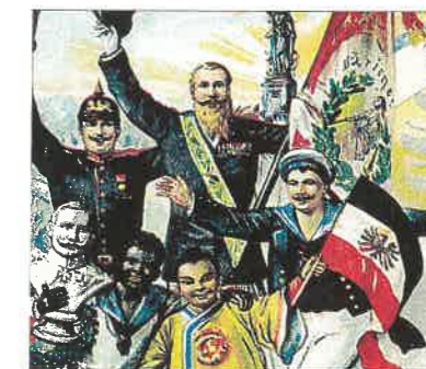
Plakát propagující významné postavení a vliv Německa ve světě

Pomocí mapy koloniálních zisků v příloze učebnice si oživte znalosti o tom, které evropské státy měly v Africe a v Tichomoří své kolonie.