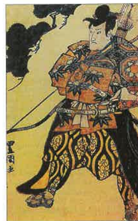
Samuraj – příslušník vojenské šlechty, která měla v Japonsku do poloviny 19. století výsadní postavení.