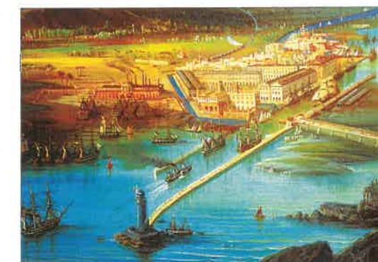
Suezský průplav na konci 19. století

Z Obchod s Afrikou a Asií usnadnilo vybudování Suezského průplavu spojujícího Středozemní a Rudé moře. Tento průplav vybudovali a otevřeli Francouzi v roce 1869. Suezský průplav zkracoval plavbu z Velké Británie do Indie ze 3 měsíců na 3 týdny.