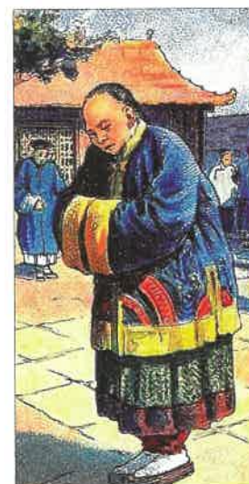
Mandarin – vysoký státní úředník, který v 19. století spravoval čínské provincie.

Z V zemi byla v této době zavedena povinná školní docházka. Začal se rozvíjet průmysl – stavěly se továrny, do nich byly z Evropy dováženy moderní stroje. Budovaly se železnice a byly otevřeny první banky. K rozvoji země přispěla i příslovečná pracovitost Japonců. Změny nastaly i ve státní správě. Všechny dosavadní výsady vojenské šlechty, tzv. samurajů, byly zrušeny. Do Japonska pronikaly evropské civilizační zvyklosti, zároveň si však Japonci uchovávali své tradice.