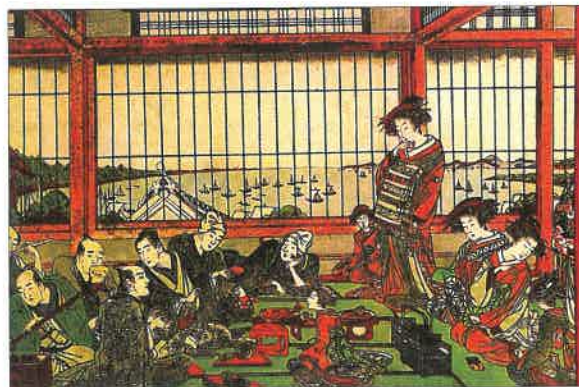
Pítí čaje a společenské hry neodmyslitelně patřily v Japonsku ke způsobu trávení volného času.

Teprve v polovině 19. století Japonsko na nátlak USA podepsalo smlouvu, podle které mohly americké obchodní lodě vplouvat do japonských přístavů. Podobné smlouvy si vynutily i další státy. Japonsko se tak díky styku se Západem, a hlavně zásluhou reform nového císaře na přelomu 19. a 20. století rychle modernizovalo. Brzy začalo s vojenskými vpády do okolních zemí.