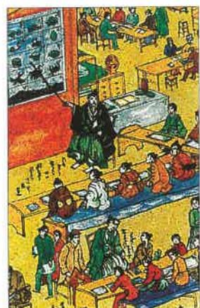
V japonské škole