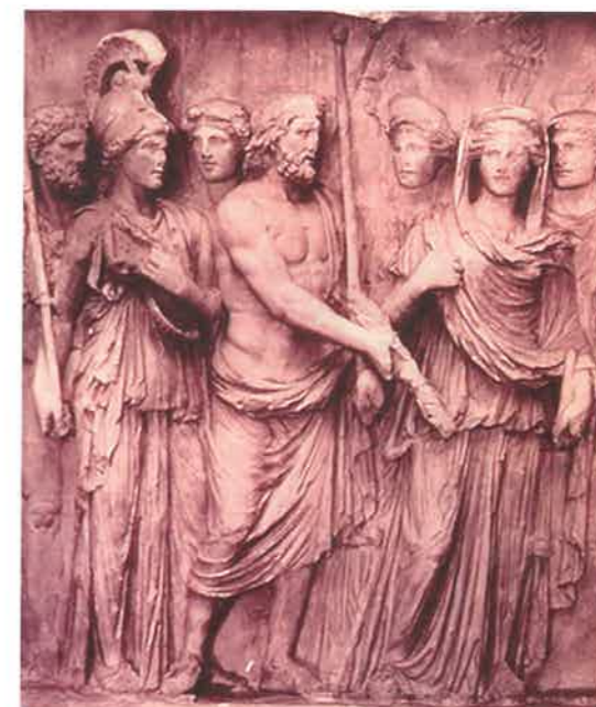
Římsí bohové (reliéf) Uprostřed do půli těla obnažený Jupiter; vpravo od něj jeho žena Juno, vlevo (s přilbou) bohyně moudrosti, války a řemesel Minerva.

Jupiter měl stejně jako Zeus bratry: boha moře Neptuna a Plutona , vládce podsvětí, mrtvých a bohatství. Mezi nejstarší uctívané bohy patřil bájný král Itálie a bůh úrody Saturnus . Bohem války byl Mars .