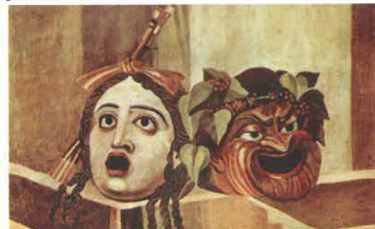
Divadelní masky pro tragédii a komedii

Z Herci byli obvykle otroci nebo propuštěnci , protože Římané nepovažovali herectví za úctyhodné povolání. Úspěšní herci však byli velmi populární. Ženy dokonce nesměly sedět v blízkosti jeviště, aby náhodou neměly pokušení utéct s některou z hereckých hvězd.