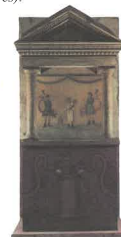
Oltář domácích bůžků

Patricijové projevovali velkou úctu svým zemřelým předkům , jejichž voskové masky uchovávali rovněž ve svém domě.