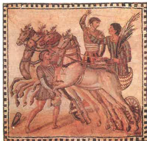
Vozataj získává za vítězství palmovou ratolest

Z Řecka se do Říma rozšířily závody jezdců (vozatajů) na dvoukolých vozech tažených koňmi . Zpočátku byly součástí náboženských svátků. Později se konaly i samostatně a staly se po zápasech gladiátorů další oblíbenou zábavou Římanů.