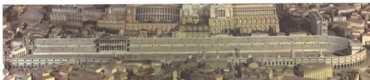
Cirkus Maximus byl přes 600 m dlouhý, vešlo se sem až 250 000 diváků, víc než na kterýkoliv dnešní sportovní stadion

Dostihy směli sledovat jen římsí občané. Na rozdíl od gladiátorských her však mohli na tribunách sedět muži i ženy společně. Vozatajové byli původně svobodní občané. Když se tento sport stal profesionálním, závodilo stále víc propuštěných otroků. Diváci na vítězství jednotlivých vozatajů uzavírali sázky.