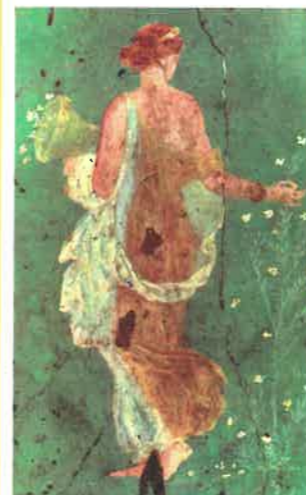
Flora, bohyně květin a jara

Třetí nejdůležitější římskou bohyní byla bohyně moudrosti, války a řemesel Minerva , obdoba řecké Athény. Tito tři bohové byli uctíváni jako ochránci města Říma v chrámu na vrchu Kapitol.