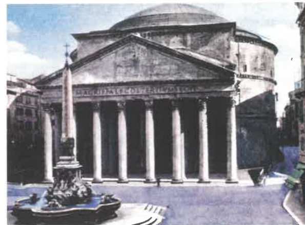
Římský Pantheon Chrám zasvěcený všem římským bohům.

Na oltáře před chrámy byly přinášeny oběti, aby byli bohové lidem nakloněni. Často se obětovala zvířata.