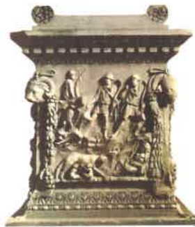
Římský „pohanský“ oltář Oltáře stávaly v chrámu i před ním.