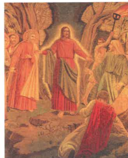
Zatčení Ježíše Krista

Římané věřili v mnoho bohů. Většinu božstev, mýty o nich i podobu chrámů převzali od Řeků. Uctívali i „domácí“ božstva. Bohům byly zasvěceny chrámy a oltáře. Nové náboženství – křesťanství – vyznávalo víru v jediného Boha a hlásalo rovnost mezi lidmi.